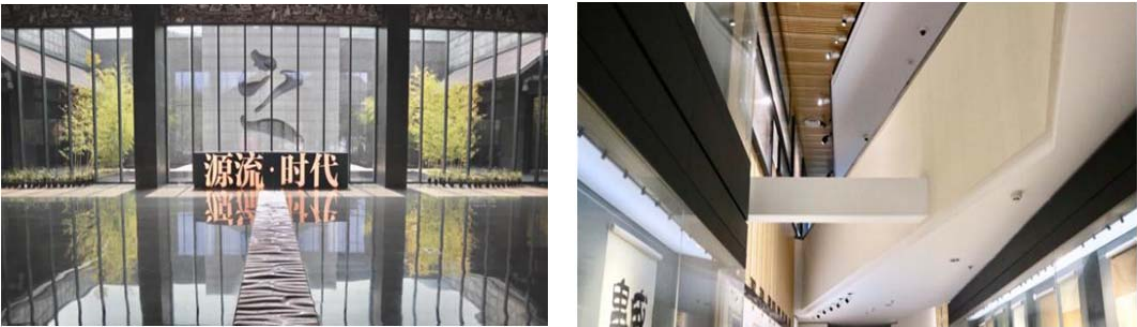
图 7 兰亭书法博物馆

走进博物馆序厅(图 7), 便是一面透明的玻璃墙, 幕墙之后, 溪水潺潺, 两旁翠竹涟涟, 春意盎然, 巨幅“之”字刻于石壁之上, 引人入胜, “之”字仿佛是一条小溪一直流淌到入口。向左走便依次进入展厅, 整个展厅是个流动的空间, 游览线路是流动的, 置身其中, 不知不觉由一层便到了二层; 天花板也是流动的, 用