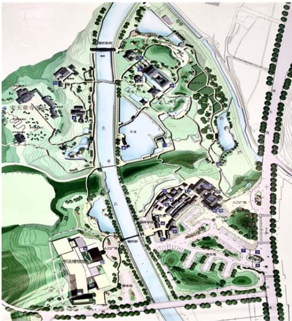
图 1 现兰亭平面图(2019 年摄于兰亭游客服务中心) Figure 1 Plane of the Lanting Pavilion (taken by the author at Lanting Scenic Area Tourist Service Center in 2019)

今兰亭中以曲水流觞最为出名,曲水流觞景区也是兰亭造园的中心区域,即王羲之等人的修楔之处。后人为重现曲水流觞之场景,纪念那时候的修楔之风,模仿其造园的风格营造了相似的场所,引鹅池之水经曲水之蜿蜒流淌最后至方池形成一个动态且灵动的水流,其可单独成景又可与周围的山石、植物交相辉映,好似一幅自然山水景观图。除此之外,后人在模仿古代