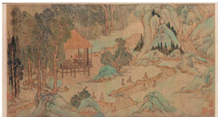
图5 兰亭修禊图 [22]

兰亭在水体营造上, 做得非常成功, 有面域宽阔的乐池, 也有精巧的鹅池, 还有蜿蜒的曲水流觞, 仅仅一个曲水流觞便吸引了万千文人雅士(图5)。作为兰亭中重要元素的水流, 诗人们纷纷对它进行了描述, 如王羲之的“清流激湍, 映带左右”, 谢安的“遇霄垂雾, 凝泉散流”, 王彬之的“淶水扬波, 再浮再沉”, 谢万的“谷流清响, 条鼓鸣音”, 徐丰之的“清响拟丝竹, 班别对绮疏”, 孙绰的“穿池激湍, 连滥觞舟”等诗句 [21] , 从这些优美的诗句中都可以看出兰亭水流营造的成功。兰亭的造园者用水系连通